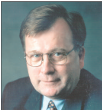
Claus Hjort Frederiksen.

Konsekvenser for den dømte minister? Tjah ... hvad tror du?