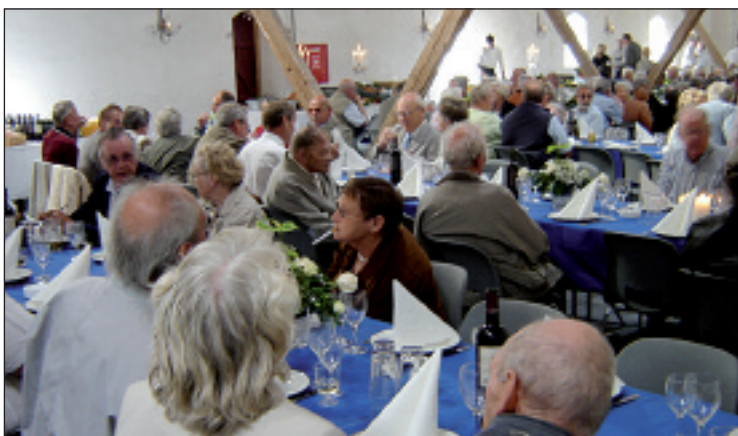
Og så på Knivholt for at få mad og svingom.