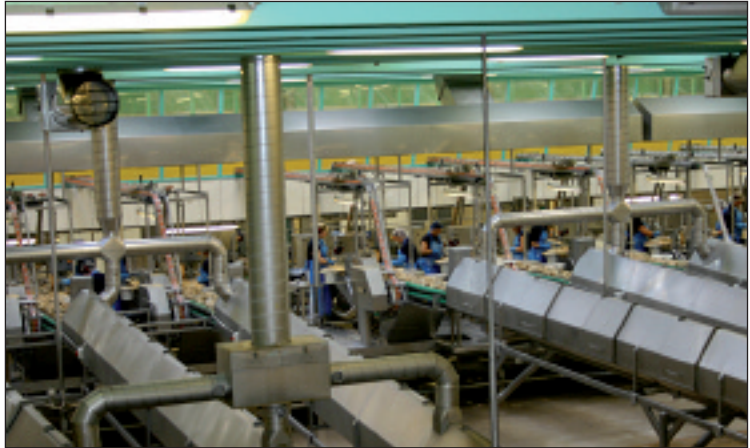
Gang i produktionen på de mange linier.

Når fisken begynder sin vandring på produktionslinierne koges den først ved hjælp af damp og senere afkøles den. Det går der halvanden time med. Så pakkes der på dåse og 3Ferne står ved li-